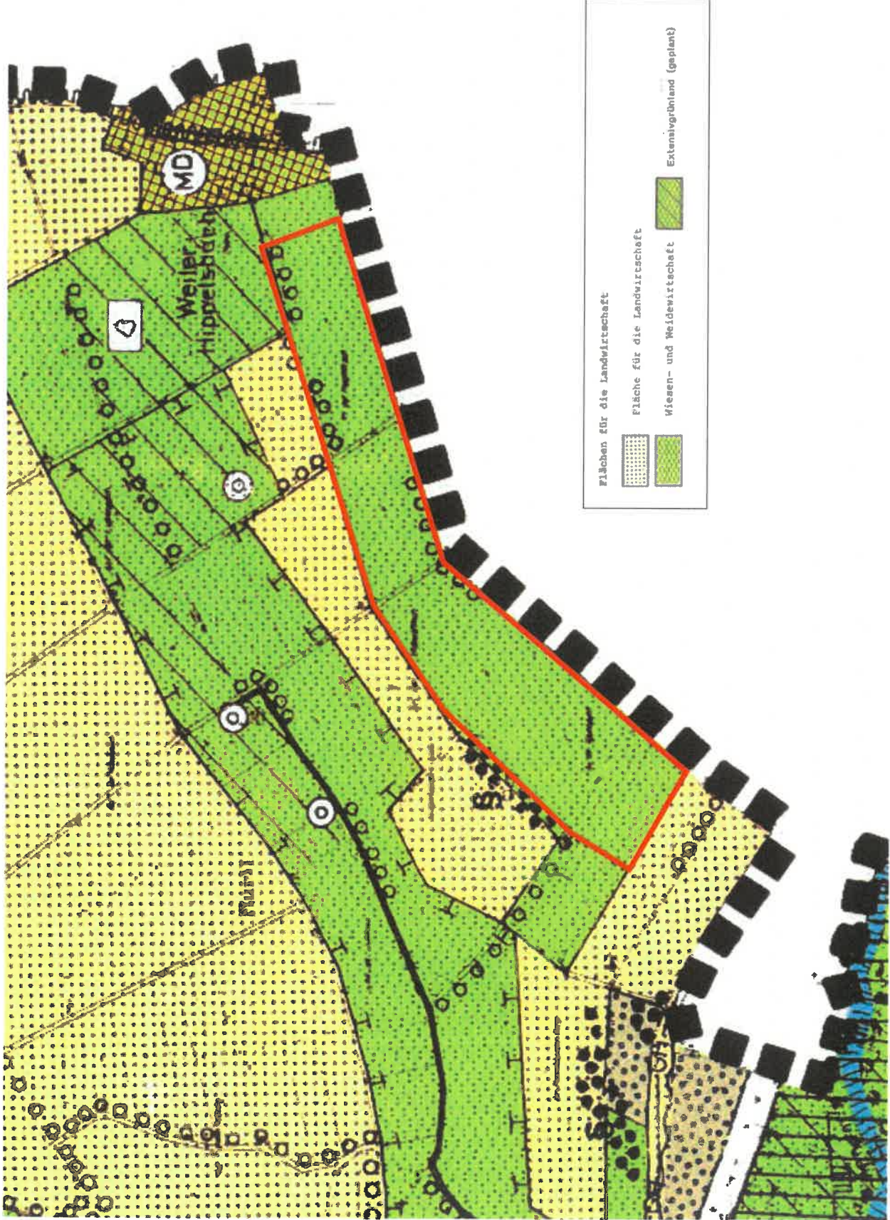
Projekt „Photovoltaikpark – Hippelsbach“